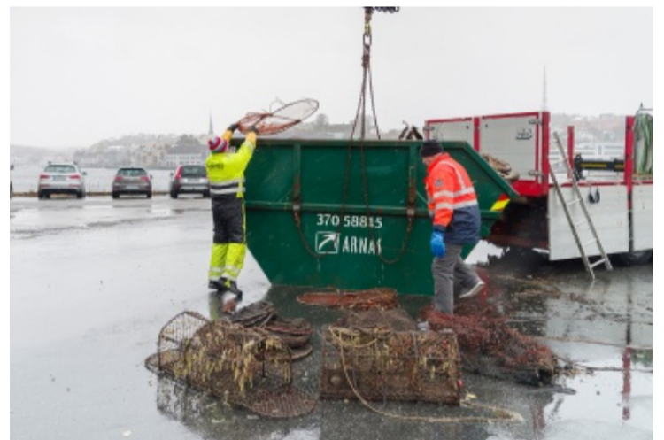
BLE FULL: I mars leverte de en konteiner med 1.200 kilo skrot, nå venter de spent på vekten på denne.