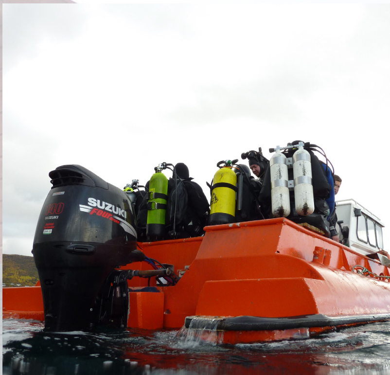
Dykking i Narvik havn